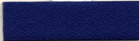
Dess.089, PG A / PG 0 R 6 A 91 T 3