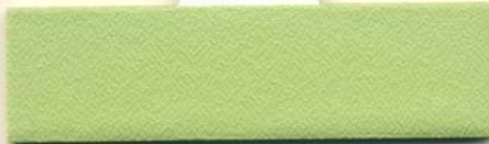
Dess.090, PG A / PG 0 R 39 A 30 T 31