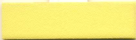
Dess.087, PG A / PG 0 R 49 A 11 T 40