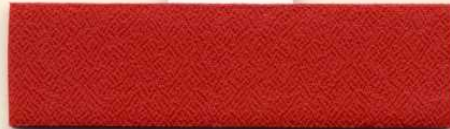
Dess.079, PG A / PG 0 R 13 A 79 T 8