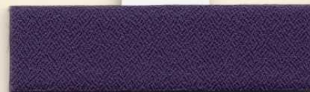
Dess.078, PG A / PG 0 R 9 A 86 T 5