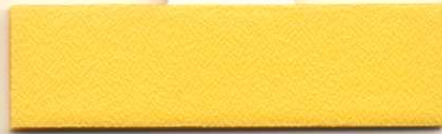
Dess.088, PG A / PG 0 R 43 A 22 T 35